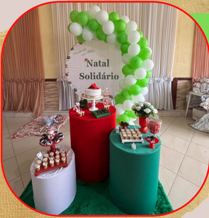
Natal Solidário "Reciclando com Anna" 2025