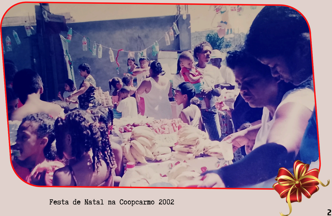
Festa de Natal na Coopcaro 2002

O Evento Natalino da Coopcaro é, assim, um exemplo vivo de superação e transformação social. Uma experiência que inspira outros grupos, sensibiliza doadores e mobiliza voluntários, reafirmando que, quando caminhamos juntos, é possível transformar realidades e renovar esperanças.