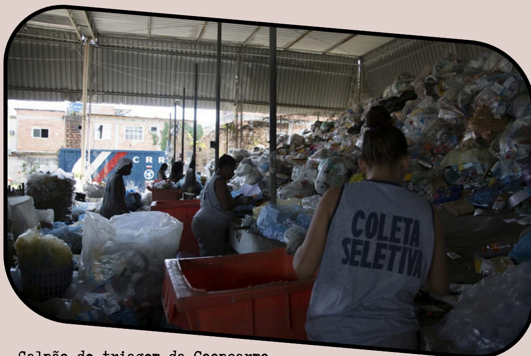
Galpão de triagem da Coopcarmo

Às mulheres que já atuaram neste processo, às egressas, às que participam atualmente e provavelmente às que virão, cabe o reconhecimento pela memória, sempre viva. Portanto, é fundamental que este assunto vivenciado por cada participante seja de entendimento coletivo por meio das artes, sobre pertencimento, autorreconhecimento, além do trabalho socioambiental que certamente reduz impactos ambientais para toda a sociedade. Alcançar a promoção das Políticas Públicas para o reconhecimento e valorização dos catadores e sua importância nesta cadeia produtiva é fundamental. Com parceiros, essa meta de longa trajetória se torna possível.