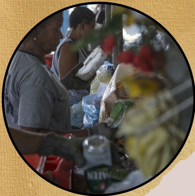
Galpão de triagem da Coopcarmo

Veja os registros das oficinas em nossas redes sociais e conheça mais sobre nossas ações em nosso site.