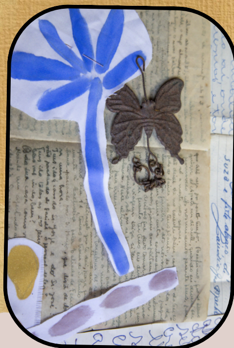
Instalação da Linhas do Tempo no Centro de Memória Coopcarumo