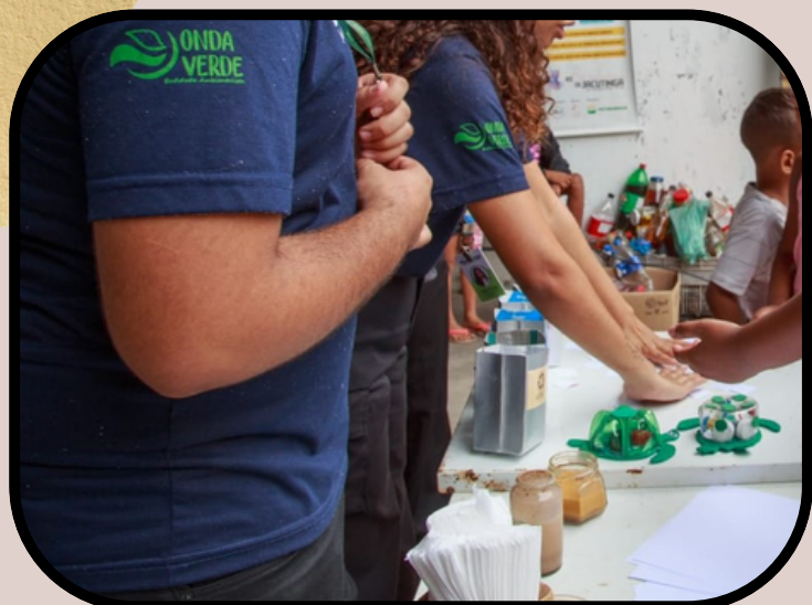
Oficinas lúdicas tinta com pigmento natural